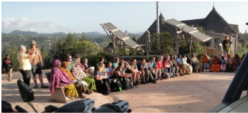
Optreden bij MamboViewpoint januari 2017